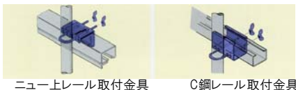
ニュー上レール取付金具