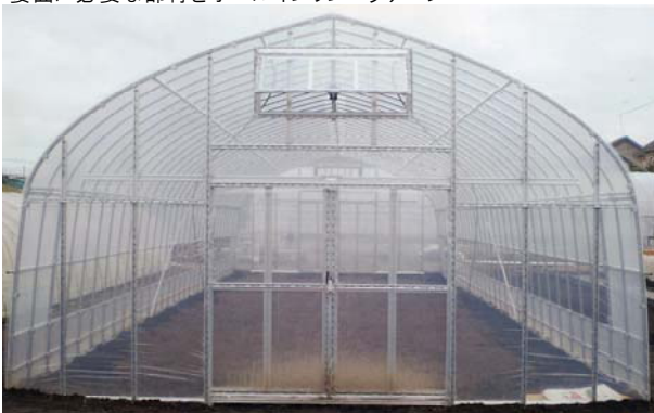
ニュービニツマ規格表