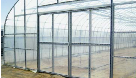
テイペッドアプラス取付金具